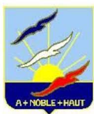
L'Ecole des Pupiles de l'air